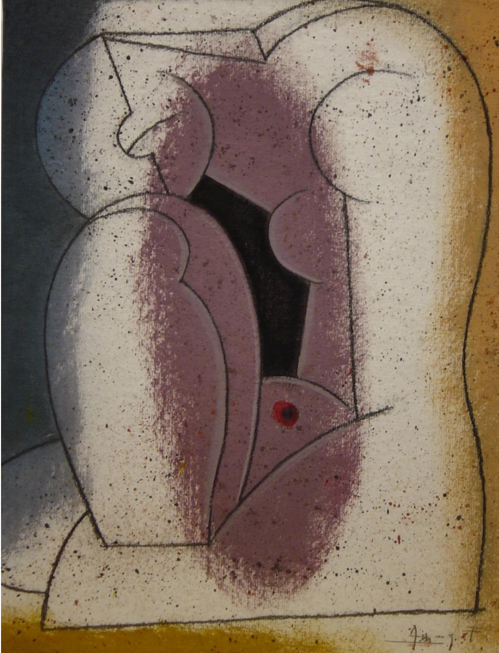
Dona. 35 x 27 cm. mixta/paper. 2007.