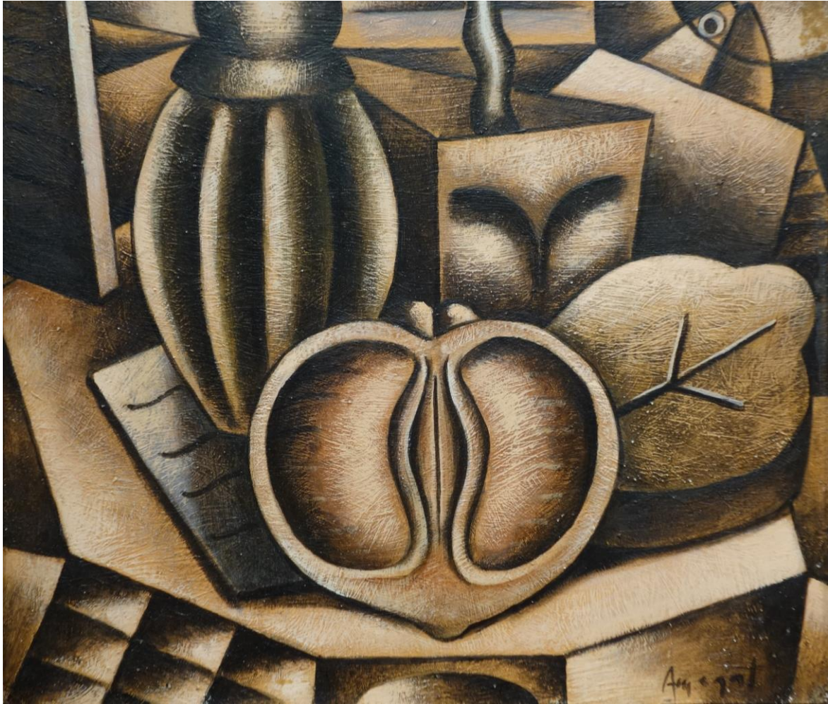
Restes del naufragi. 24'5 x 28 cm. acrílic/paper-fusta. 1999.