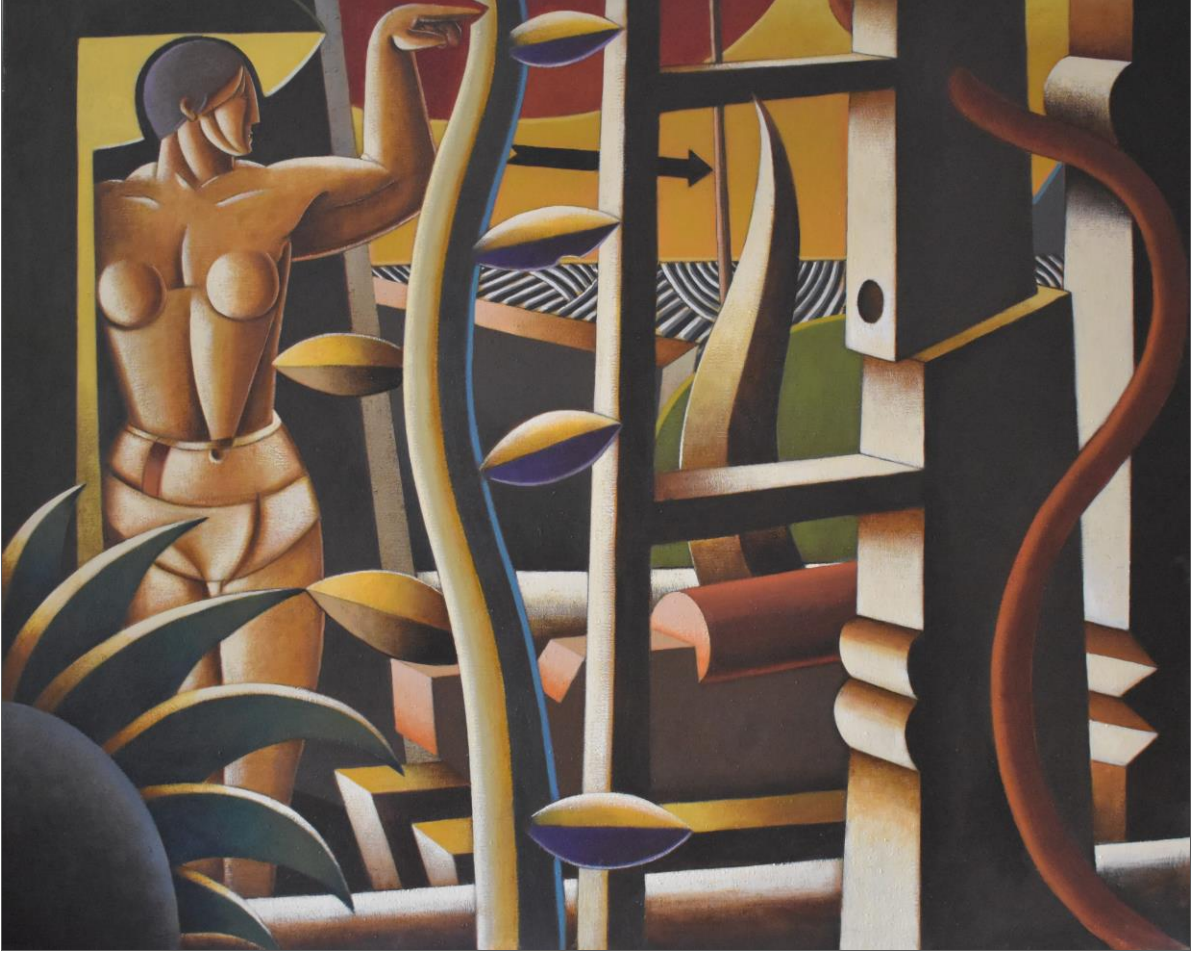
Personatge sota un cel estrany. 130 x 162 cm. acrílic/tela. 2008.