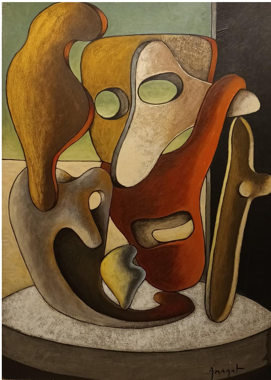
Formes i forats II. 53 x 37'5 cm. acrílic/cartró. 1996.