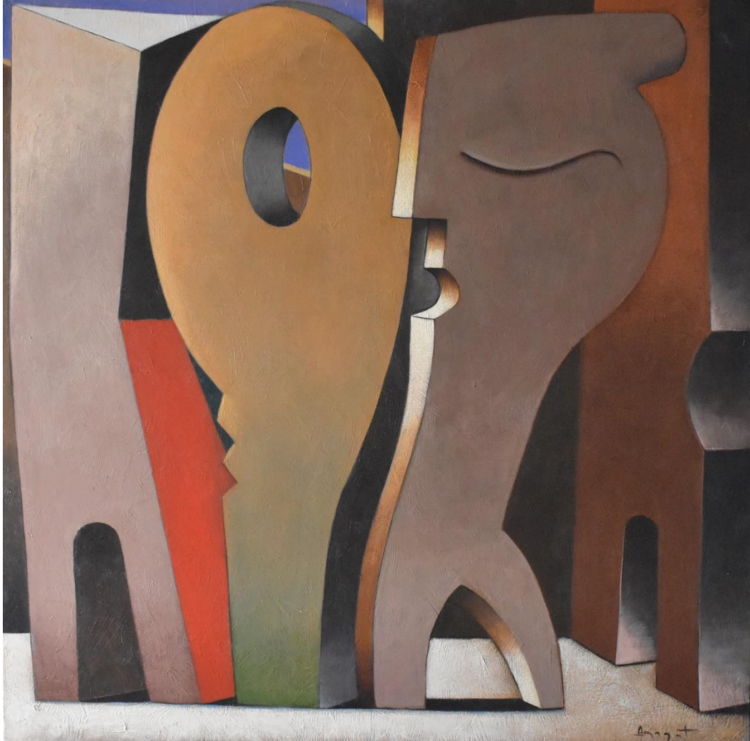
Tres figures amb un ull. 100 x 100 cm. acrílic/tela. 2009.