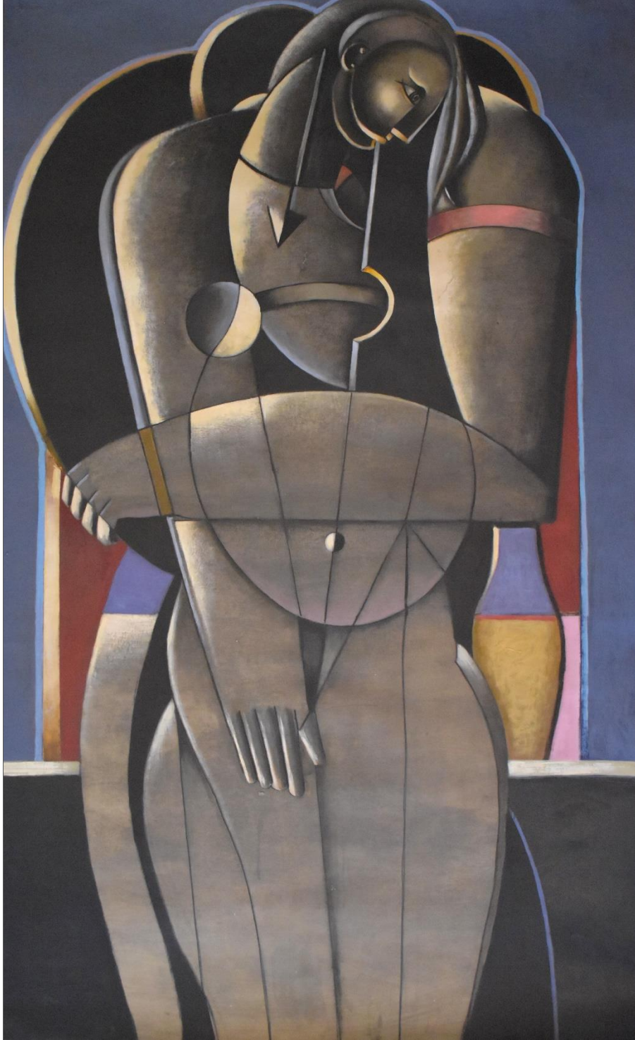
Gran figura amb ombra. 180 x 110 cm. acrílic/paper. 2020-24.