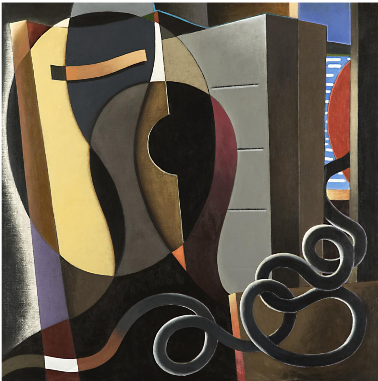
Entre el mirall i el mur. 150 x 150 cm. acrílic/tela. 2018.