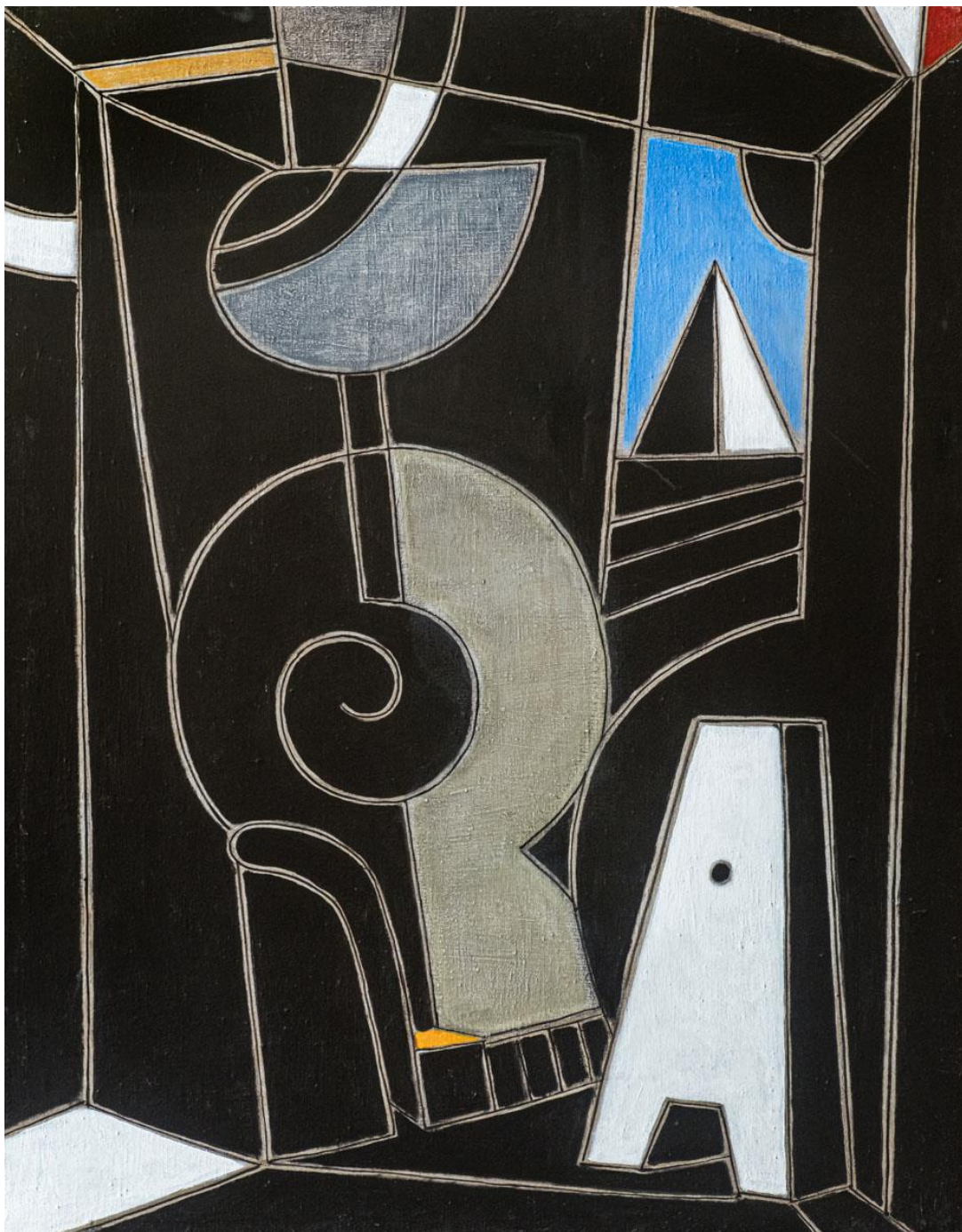
Alfa-Omega. 92 x 73 cm. acrílic/tela. 2022.