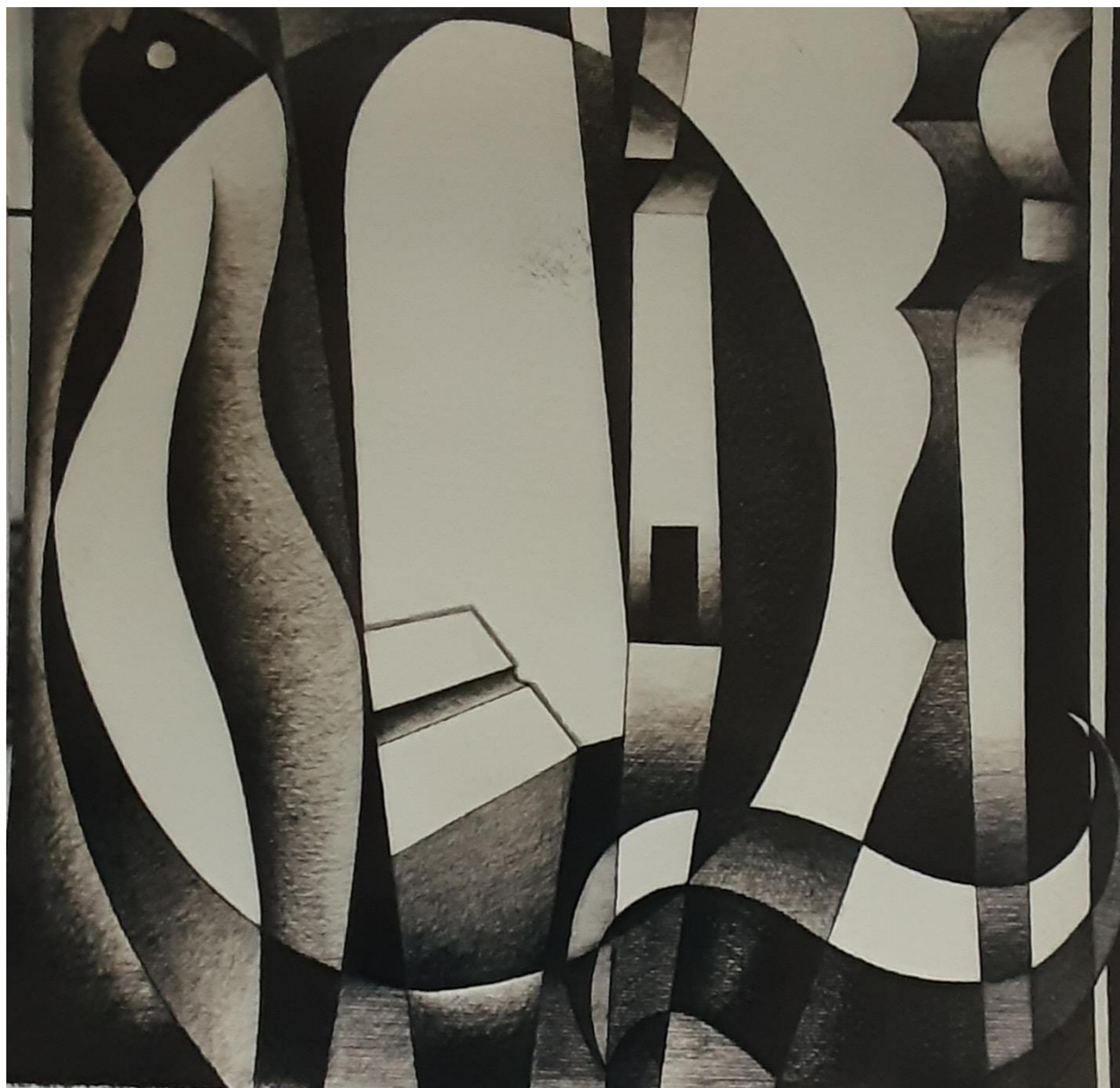
La porta. 100 x 100 cm. carbonet/cartró. 2011