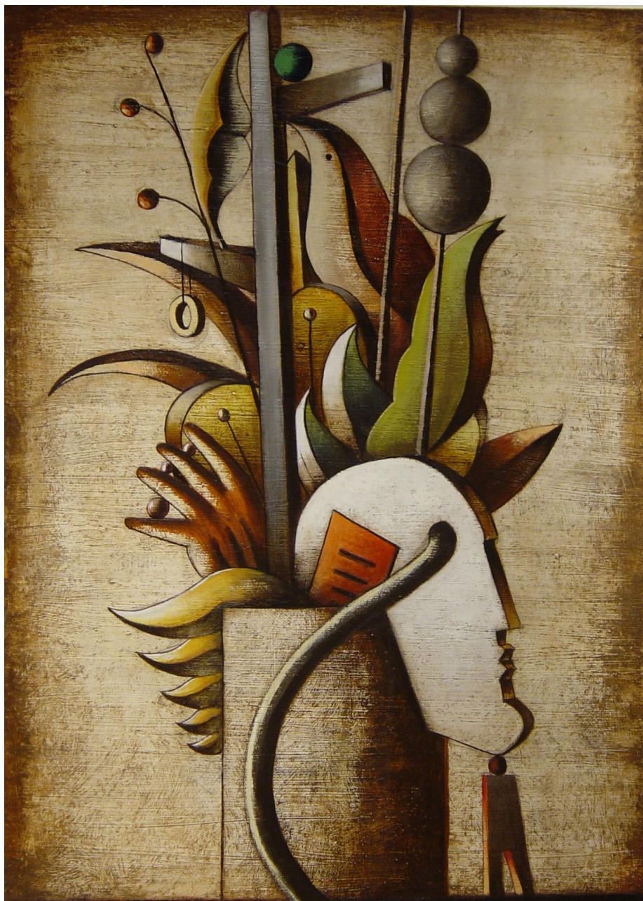
Test, màscara, ocell. 70 x 50 cm. acrílic/cartró.2007.