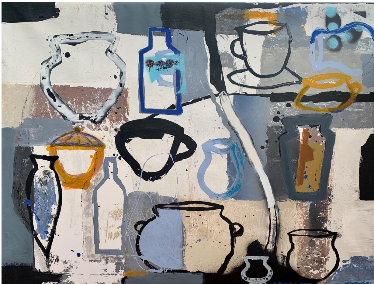
12. S / T. Acrílico / tela. 97 x 130 cm. 2023.