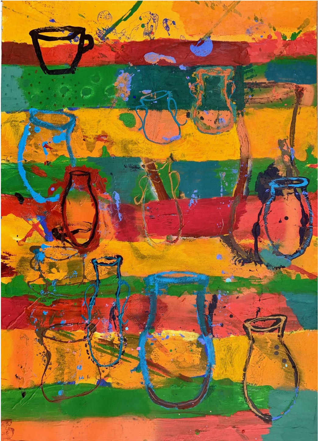
2. S/T. Acrílico / cartón. 105 x 75 cm. 2023.