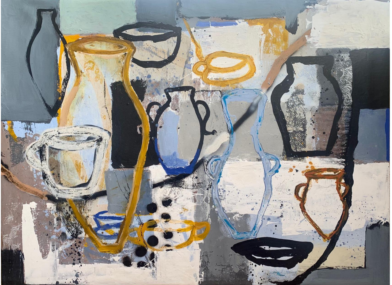
11. S / T. Acrílico / tela. 97 x 130 cm. 2023.