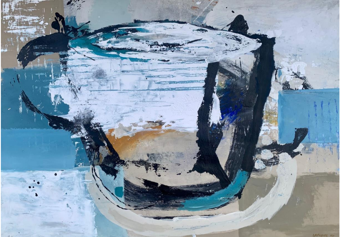
14. S / T. Acrílico / Cartón. 75 x 105 cm 2017.