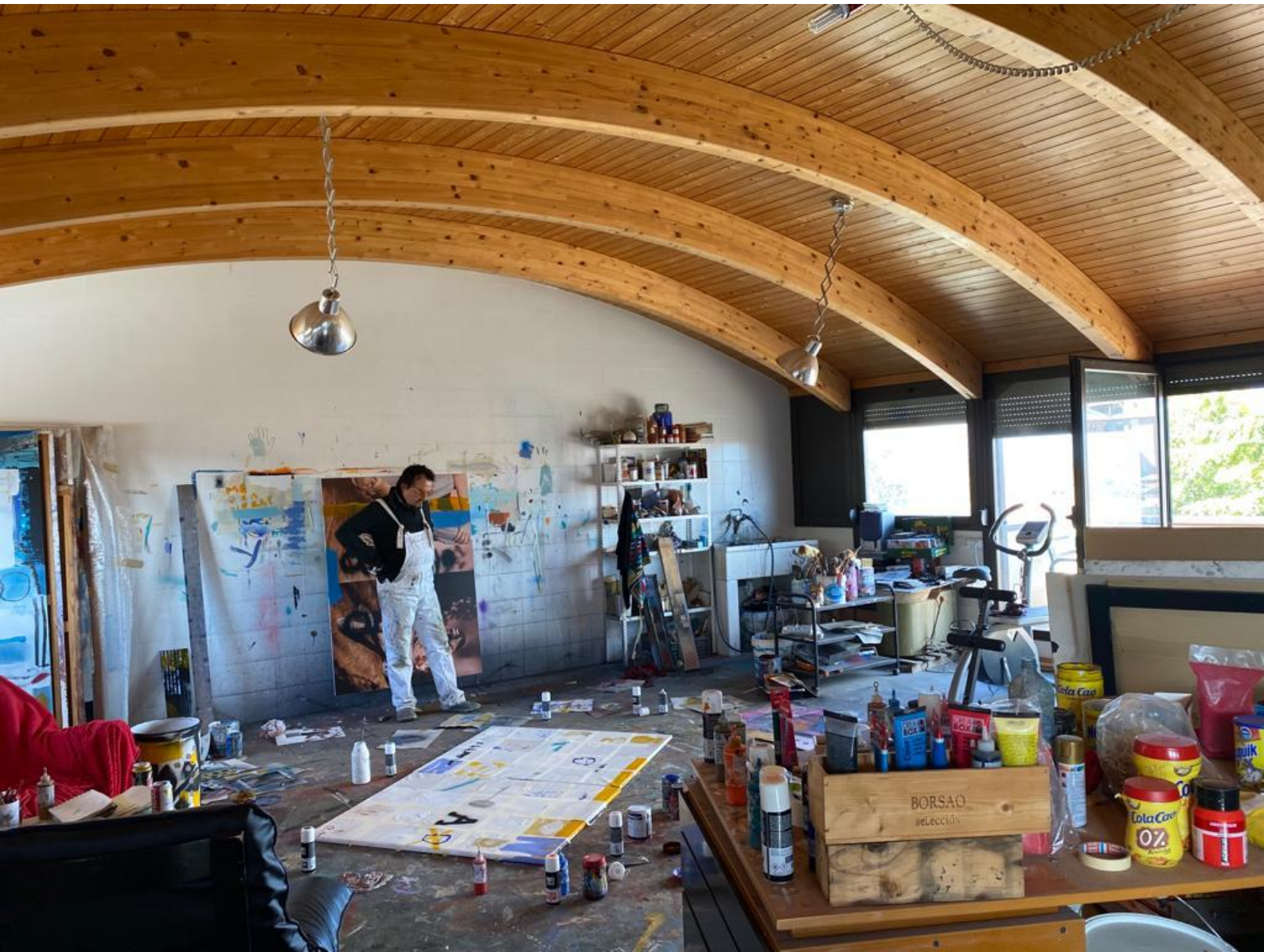
Javier Lapuente en su estudio 2022.