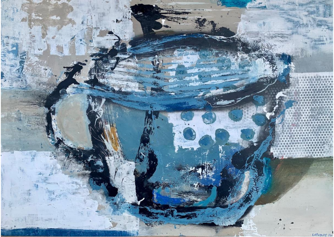
13. S / T. Acrílico / Cartón. 75 x 105 cm. 2017.