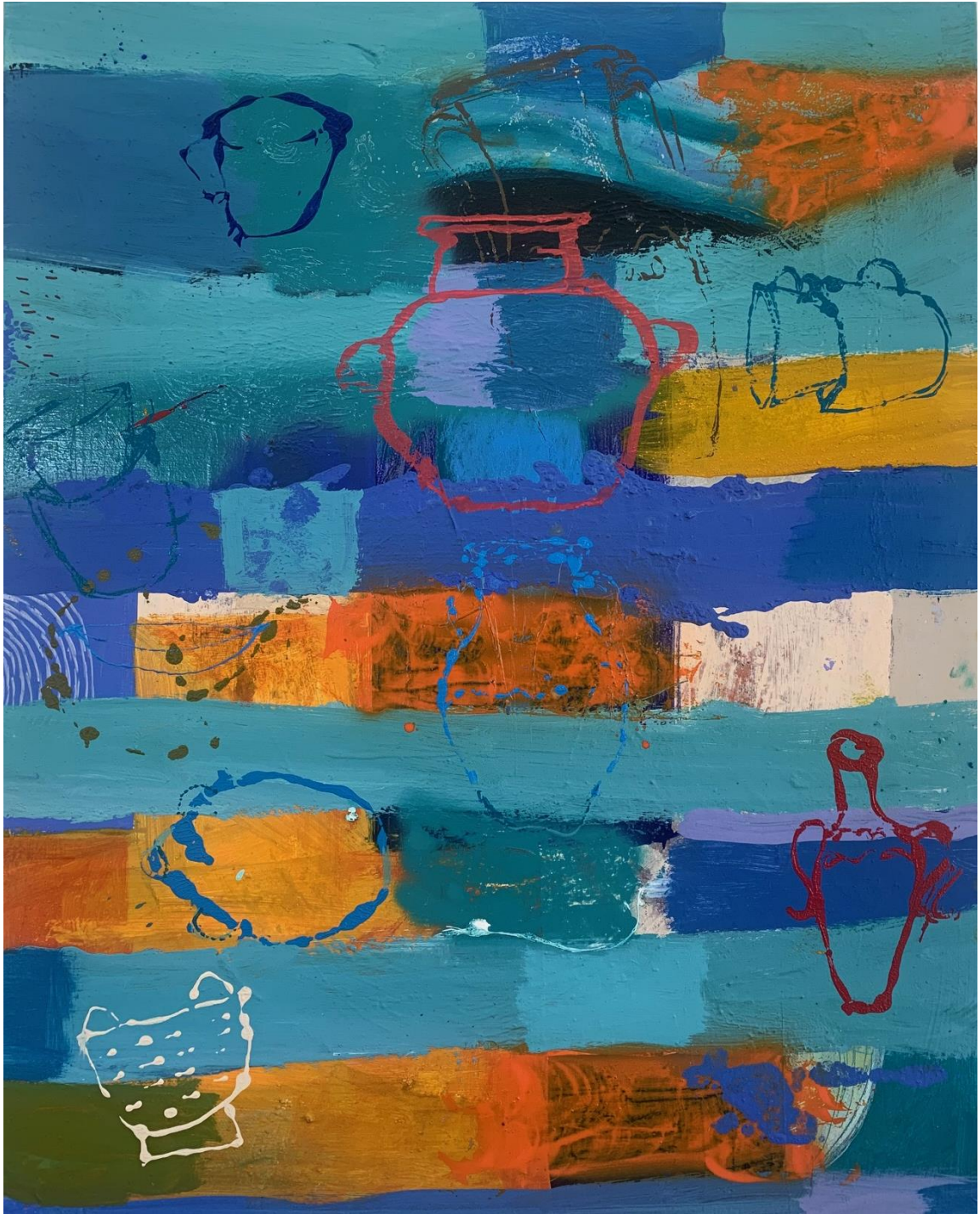
1. S / T. Acrílico / tela. 100 x 81 cm. 2023