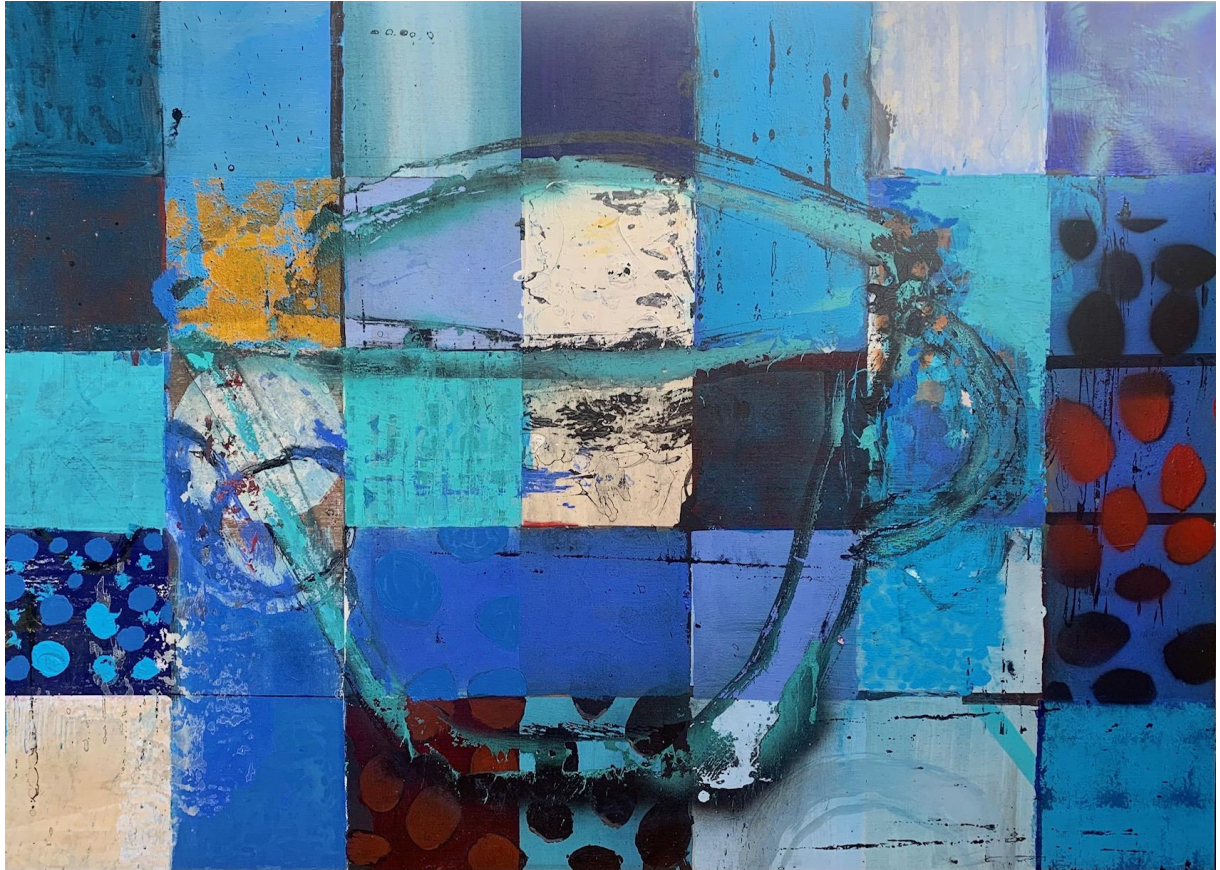
10. S / T. Mixta / tabla. 114 x 146 cm. 2022.