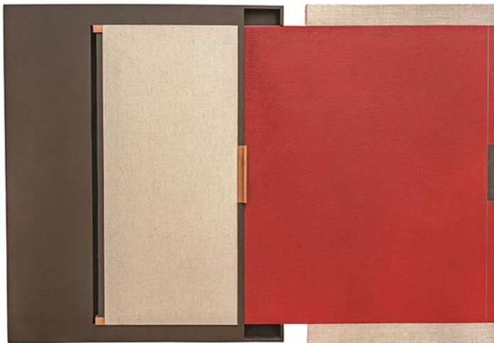
Juan de Andrés: Sin título, 2022

En totes les obres es percep la idea de silenci i reflexió. Quan les contemplem notem una sensació d’assossec i calma tan necessària avui. El seu és discurs creatiu, d’un minimalisme constructivista absolut, tal com es pot comprovar en cadascuna de les seves obres, totes elles sumides en un geometrisme ben acusat.