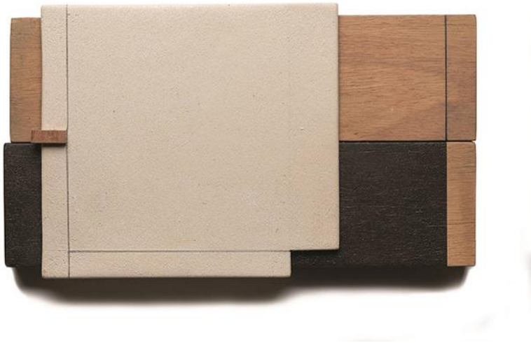
Juan de Andrés: Sin título, 2022

que El temps de les arts se'n va fer ressò. L'exposició es titula Diálogos silenciosos que reflecteix perfectament el seu contingut, on la presència del silenci és fa evident en les seves pintures acríliques sobre tela i fusta.