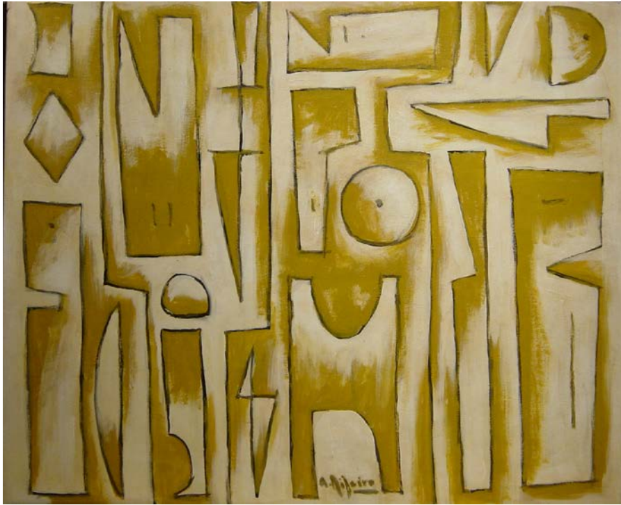
A.Ribeiro. Formas blancas (c.2006) 54 x 65 cm. oleo sobre tela.