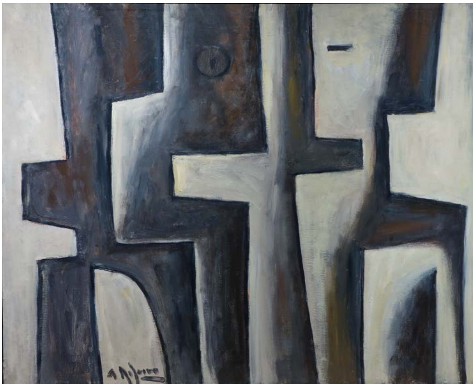
A.Ribeiro. Formas superpuestas (c.2005) 65 x 81 cm. oleo sobre tela.