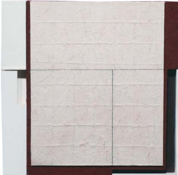
J De Andrés S/T (2017) 24 x 24,5 cm. collage papel artesanal.