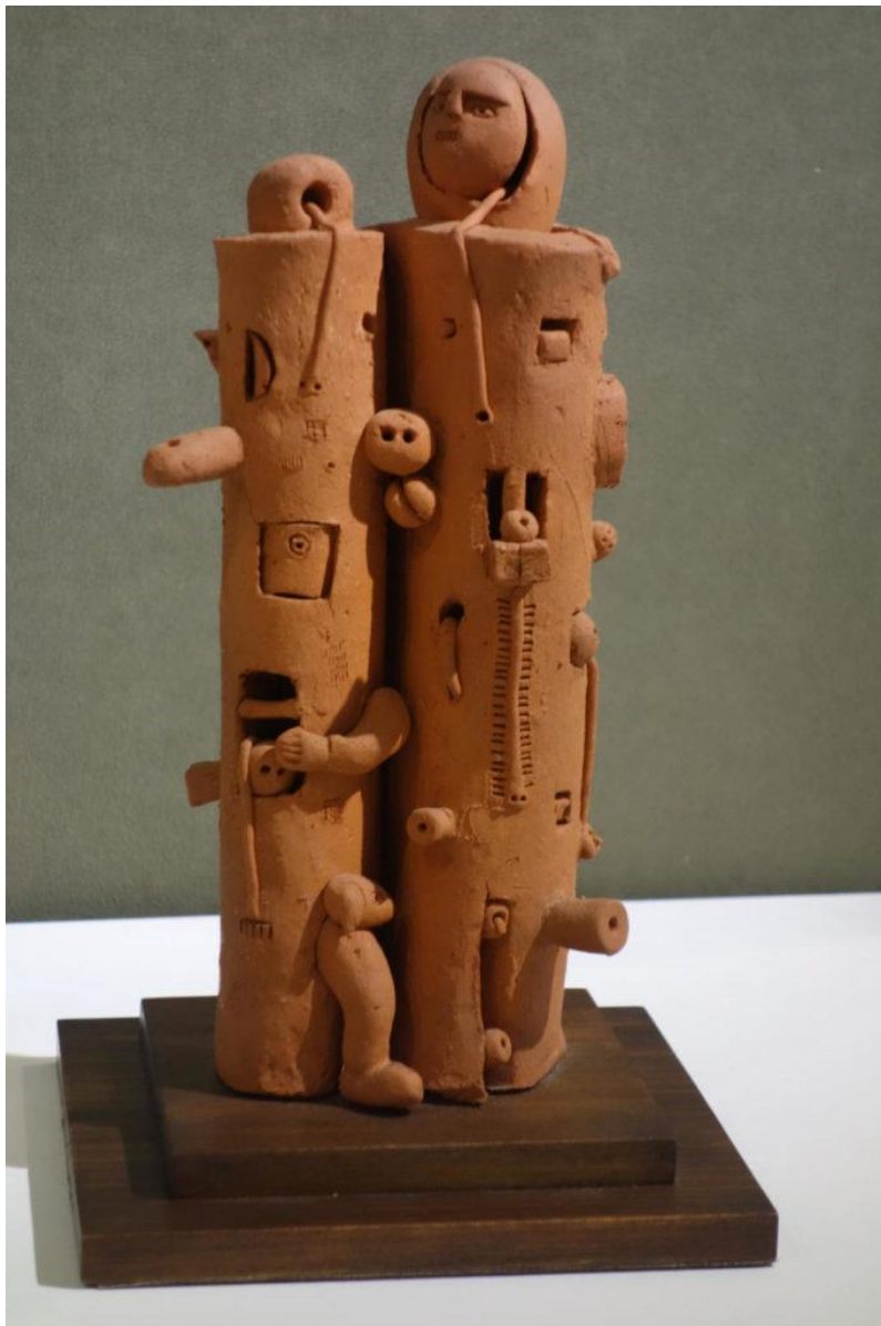
José Gurvich . Torre. 1968

tarde (1964), Estación (1966), Composición (1966) i l'aquarel·la Proyectos para esculturas V (1971). Dos anys més tard se'n va a Nova York on exhibí el seu treball en diferents exposicions, però malauradament només s'hi estarà dos anys, ja que mor en aquesta ciutat el 1974. El dibuix en bolígraf Plaza escultòrica (1972) és l'únic testimoni realitzat a Nova York que està present a la Dalmau.