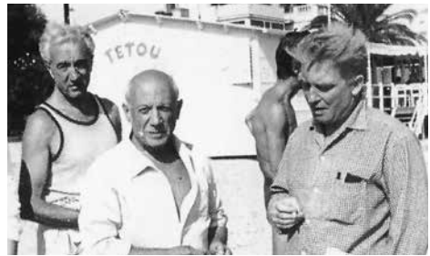
Manuel Angeles, Picasso y Pignon. 1960

Exposición en la Galerie Creuze de París.