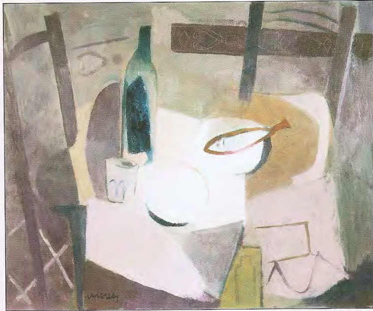
Bodegó del peix