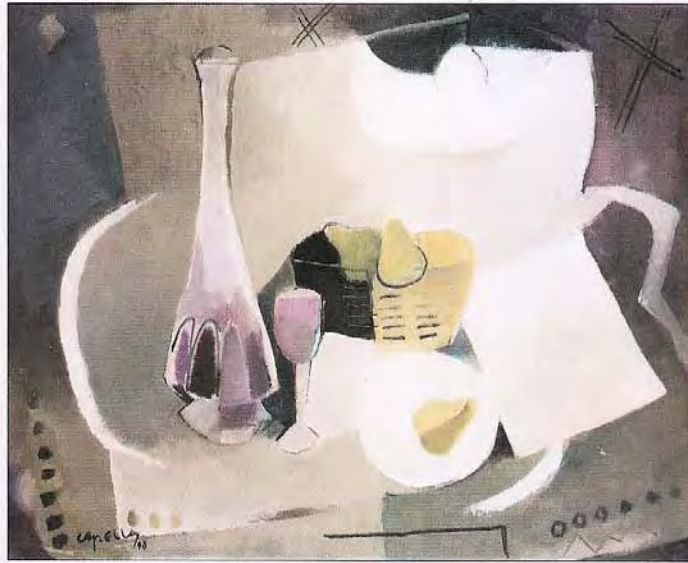
Licor de cassis i peres