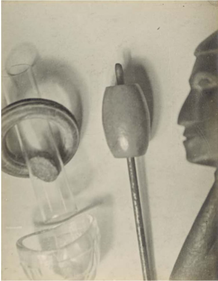
Sense títol. 23 x 18 cm.