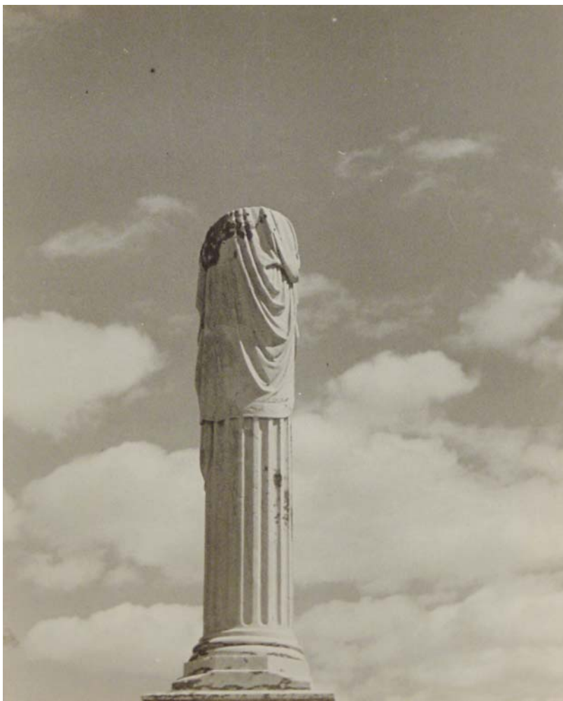
Witness. 31 x 25'2 cm.

© del catàleg: SALA DALMAU galeria d'art. © del text: l'autor. Coordinació: SALA DALMAU. Barcelona.