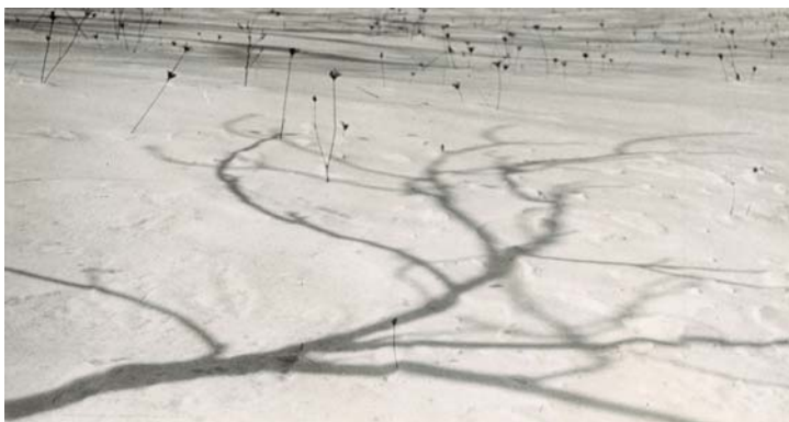
Sense títol. 15'6 x 29 cm.