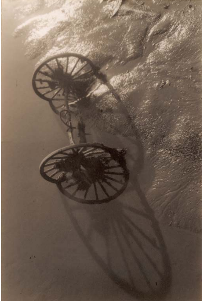
The old worker. 34'2 x 22'5 cm. 1938.