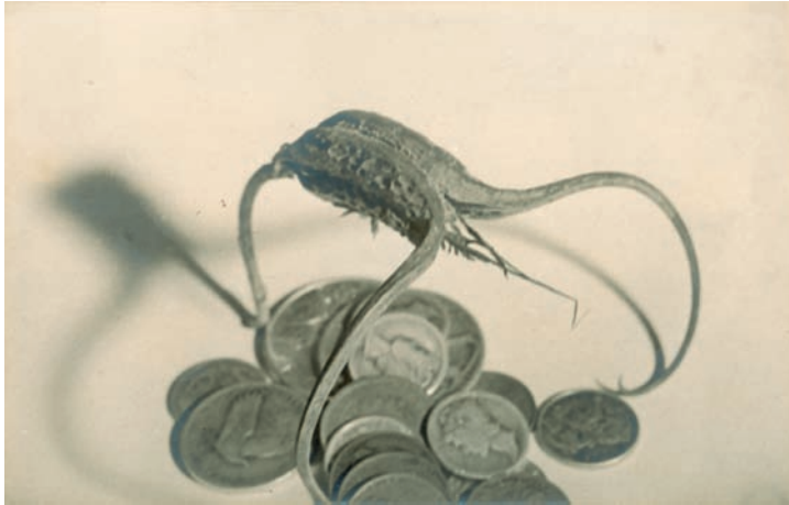
Greed. 19 x 29'4 cm.