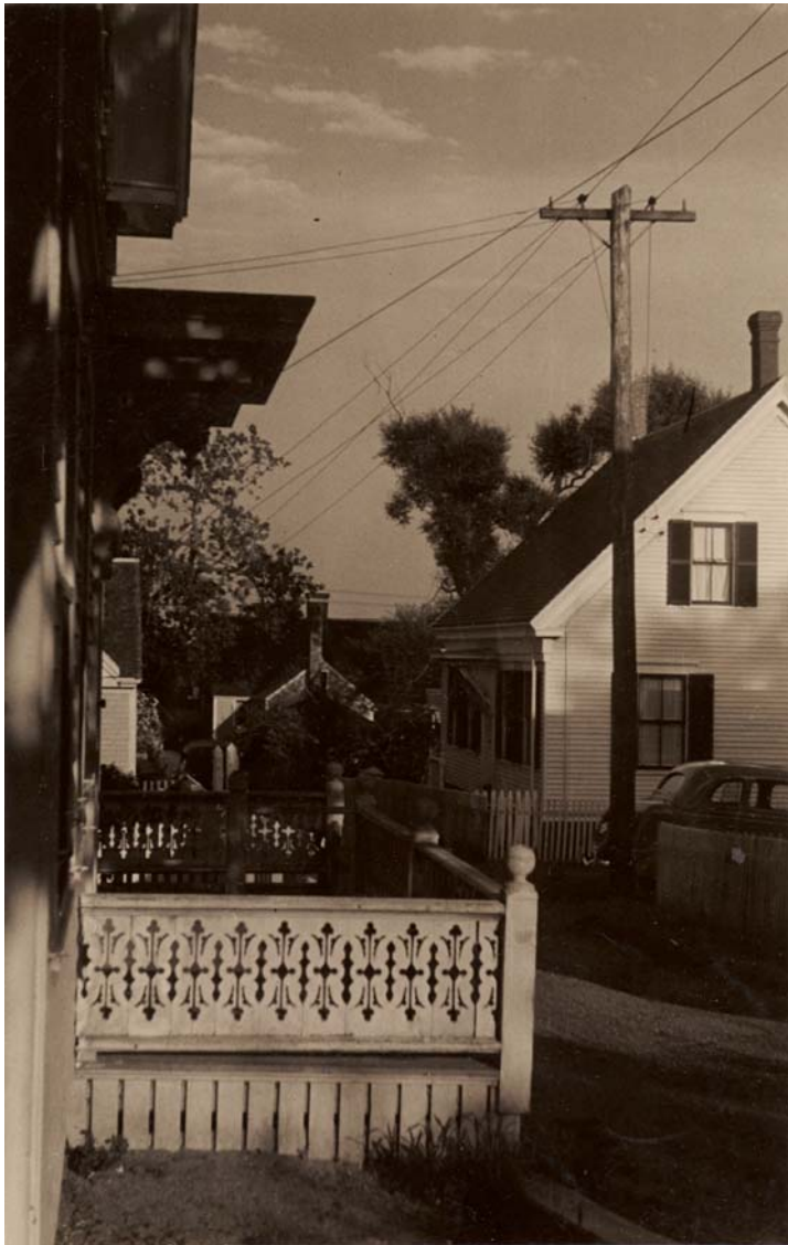
Sense títol. 24 x 15'5 cm.