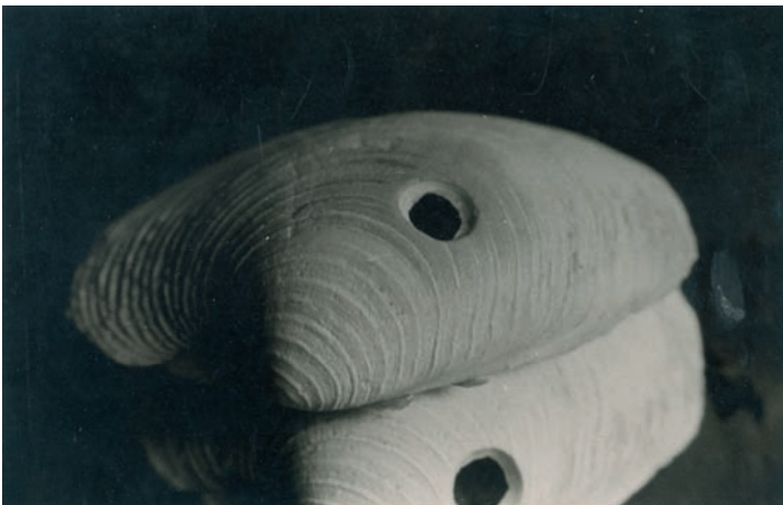
Sense fitol. 15'1 x 20'2 cm.