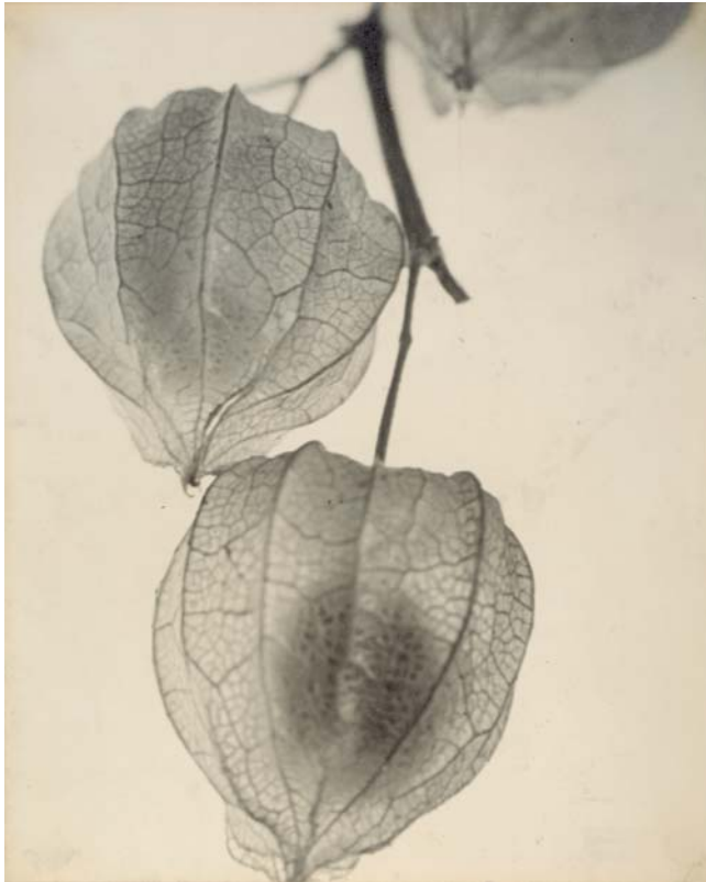
Chinese lanterns. 24 x 19'4 cm. c.1936

En esta fotografía, Alemany rinde un doble homenaje al reunir los cráneos de Georgia O'Keeffe y los celajes de Stieglitz, pero además compone un poema fotográfico no obvio, donde las estrategias de Lautréamont, de Duchamp, de la fotografía escenificada y del muy posterior "land art" se superponen y suman.