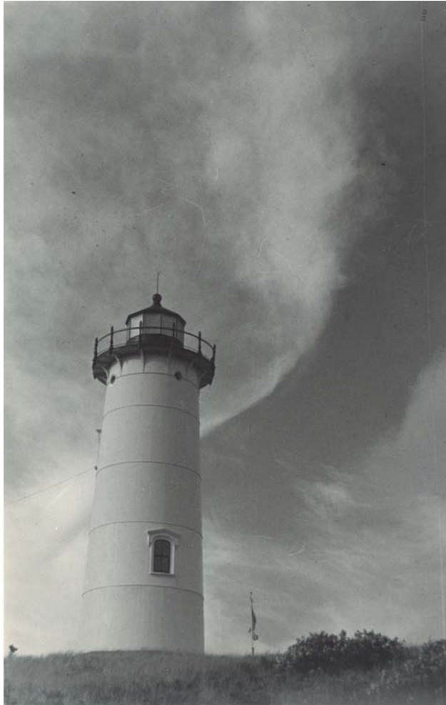
Sense títol. 30 x 19 cm.