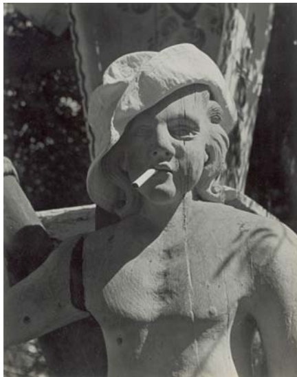
< Sophistication. 24'7 x 19'7 cm. 1938.