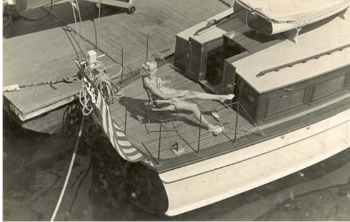
^ Expensive toys. 18'5 x 29 cm. 1937.