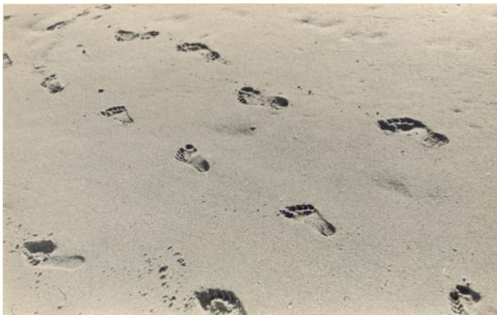
Sings of progress. 18'2 x 29'4 cm.