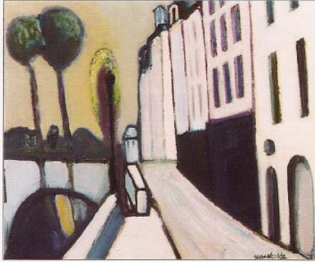
«Urbà Paris» 1996. 54 x 65 cm oli/tela.