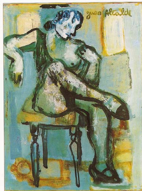
«Dona asseguda» 1996. 29 x 22 cm. oli/fusta.