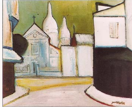
«St Pierre.Montmartre» 1996. 54 x 65 cm. oli/tela.