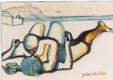
«Amor a la platja» 1996. 21 x 29 cm oli/fusta.