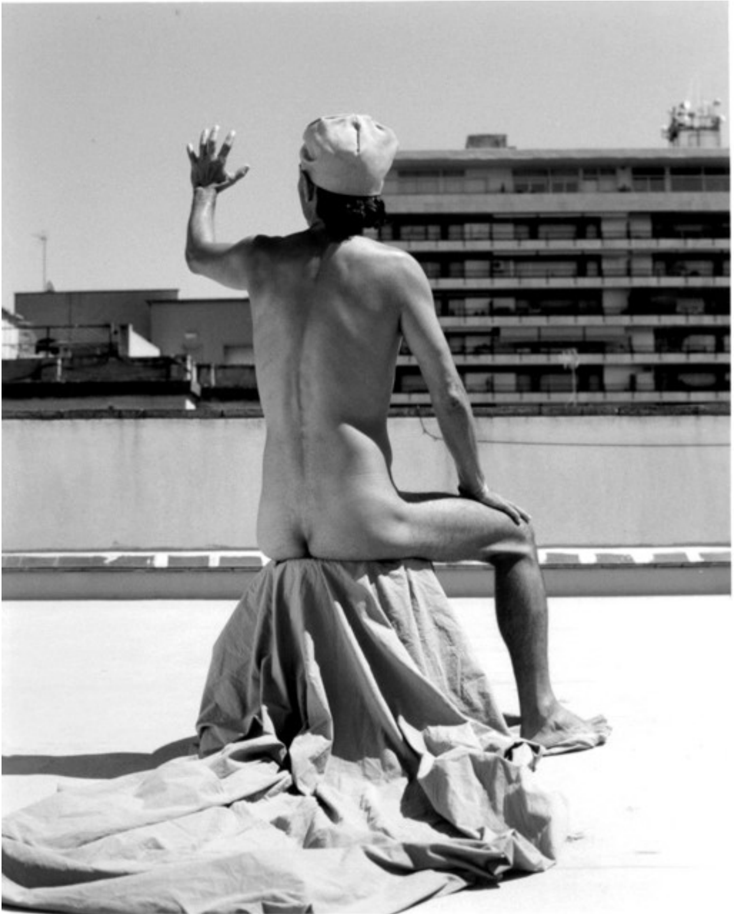
Midday Summer Dream.

Barcelona 2016. 25 x 20 cm. Gelatina de plata. 2/5