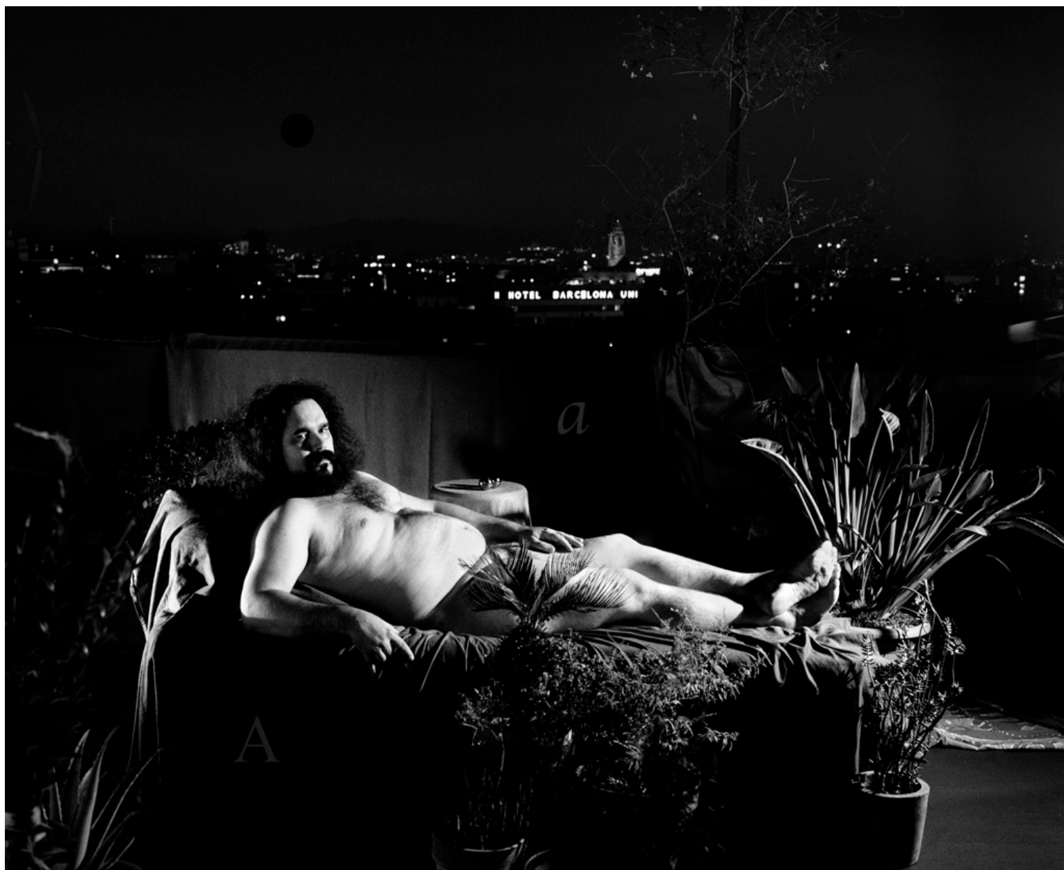
La transformació nocturna d'un lleó en J. Arromoc Barcelona 2016. 30 x 40 cm. Gelatina de plata. 3/6